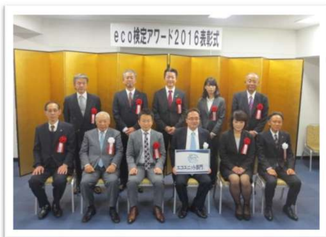
エコ検定アワード授賞式