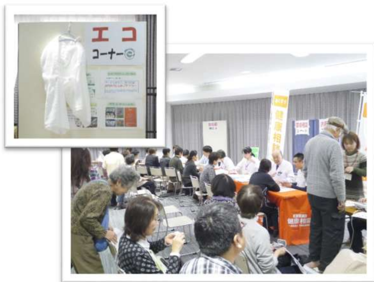
平野健康まつりの様子

11月には東京商工会議所が主催する「eco検定アワード」ユニット部門で優秀賞を頂き、授賞式において薬局で出来るエコの取り組みを紹介した。